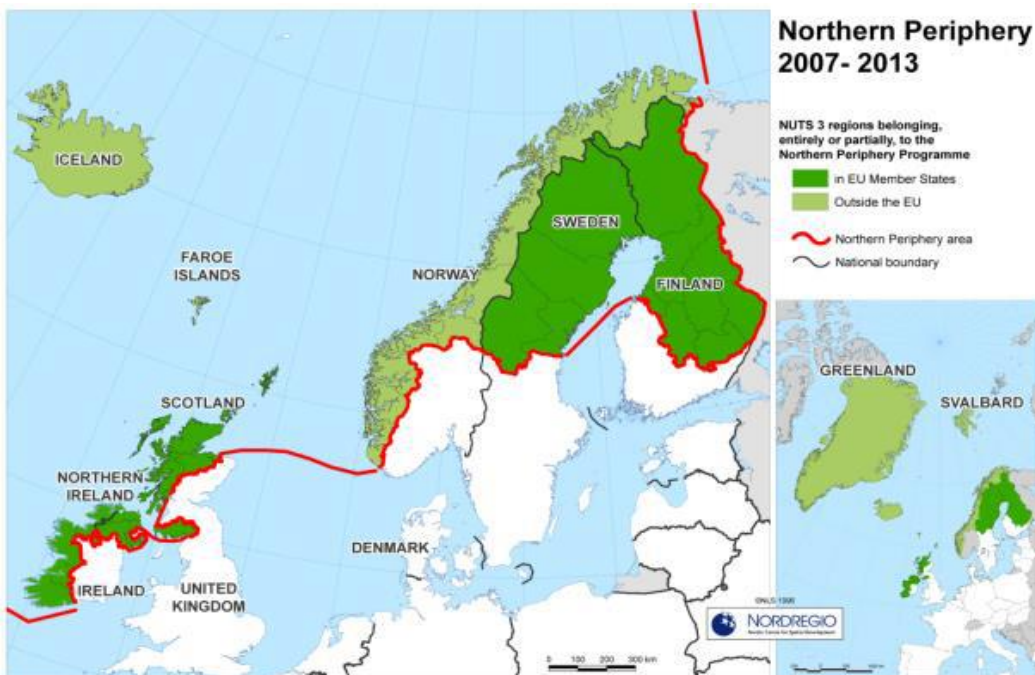
Mynd 1. Starfssvæði Norðurslóðaáætlunarinnar 2007-2013

Norðurslóðaáætlunin nær landfræðilega yfir stórt svæði, en þáttökulöndin eru Skotland, Írland, Norður-Írland, Svíþjóð, Finnland, Noregur, Ísland, Grænland og Færeyjar.