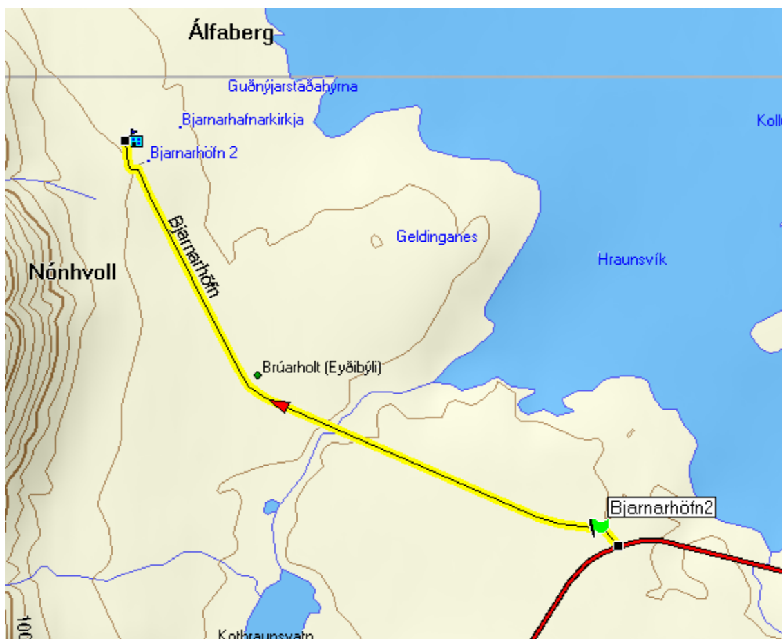
Mynd nr. 2