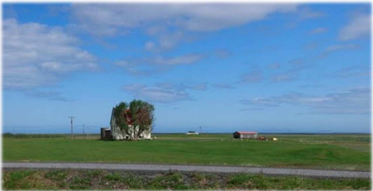
Mynd 3- Við Öxarfjörð eru mikil tækifæri