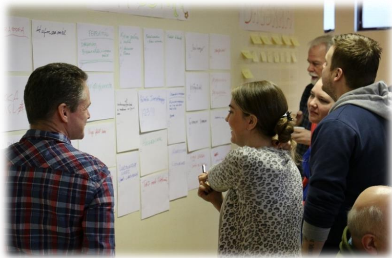
Mynd 1- Markmið og framtíðarsýn er að mestu byggt á niðurstöðum íbúaþings en tekur jafnframt mið af greiningu á stöðu byggðarlagsins

Öxarfjarðarhérað er þekkt fyrir hágæða matvælaframleiðslu er byggir meðal annars á hugvitssamlegri og ábyrgri nýtingu á auðlindum héraðsins. Ferðaþjónusta er ört vaxandi atvinnugrein í héraði stórbrotinnar, fjölbreyttrar en viðkvæmrar náttúru. Hagsmunaaðilar í ferðaþjónustu hafa tekið höndum saman og skipulagt uppbyggingu með þarfir umhverfis og samfélags í huga, ekki síður en efnahagslegar þarfir. Uppbyggilegt og samheldið samfélag þar sem framfarir í atvinnulífi, ásamt öflugum innviðum, hafa leitt til jákvæðrar íbúaþróunar á verkefnistímanum.