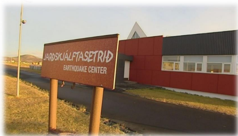
Mynd 4- Jarðskjálftasetrið er framtak öflugra íbúa