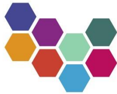
SÓKNARÁÆTLUN NORÐURLANDS VESTRA